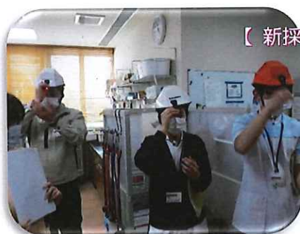
【新採用・転入職員 辞令交付式／オリエンテーション】