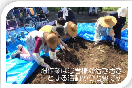
畑作業は患者様が生き生きとする活動のひとつです

今後も、患者様を中心としたチーム医療を意識し、数年後にはリハビリも「病院の顔」の1つになれるよう努めていきたいと思っております。