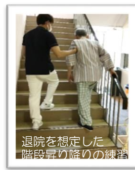
退院を想定した階段昇り降りの練習